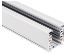
33232 TEAR N TR 2M-W

Elemento di sistema a sbarra, TEAR N TR 2M-W, 3 circuiti, bianco, (33232)