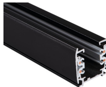
33233 TEAR N TR 2M-B

Elemento di sistema a sbarra, TEAR N TR 2M-B, sbarra collettore a 3 circuiti, nero, (33233)